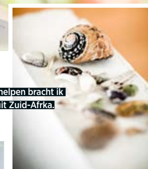
Deze schelpen bracht ik mee uit Zuid-Afrika.