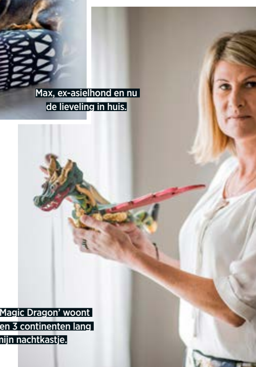
'Puff, the Magic Dragon' woont al 20 jaar en 3 continenten lang op mijn nachtkastje.